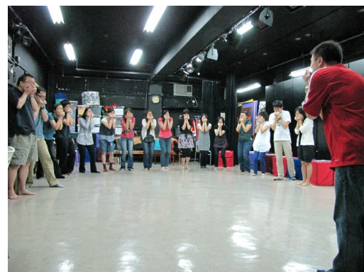
Practice non-verbal signs together