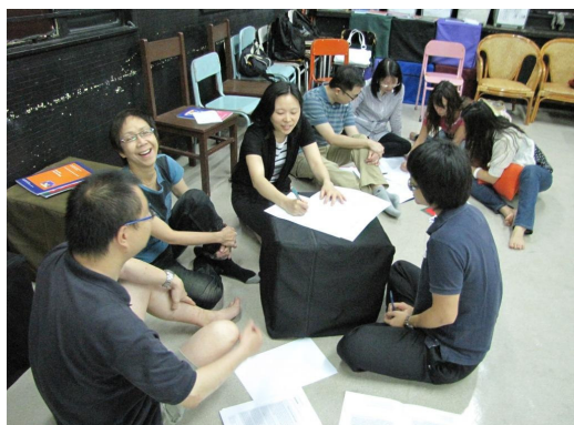
Writing scripts together