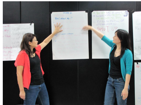
Presenting language of surprise