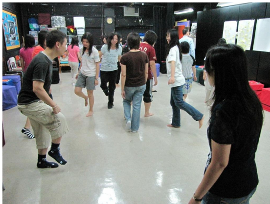
Ice breaking games