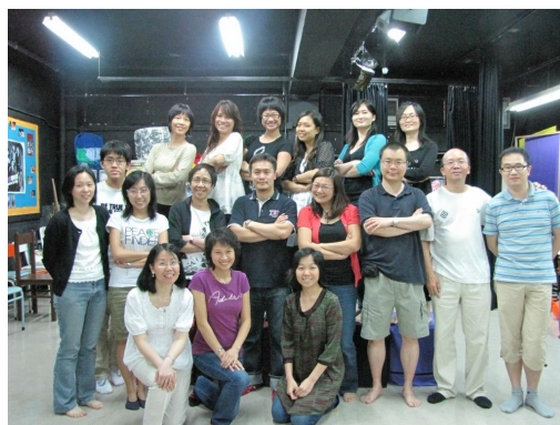
A group of smart English Teachers