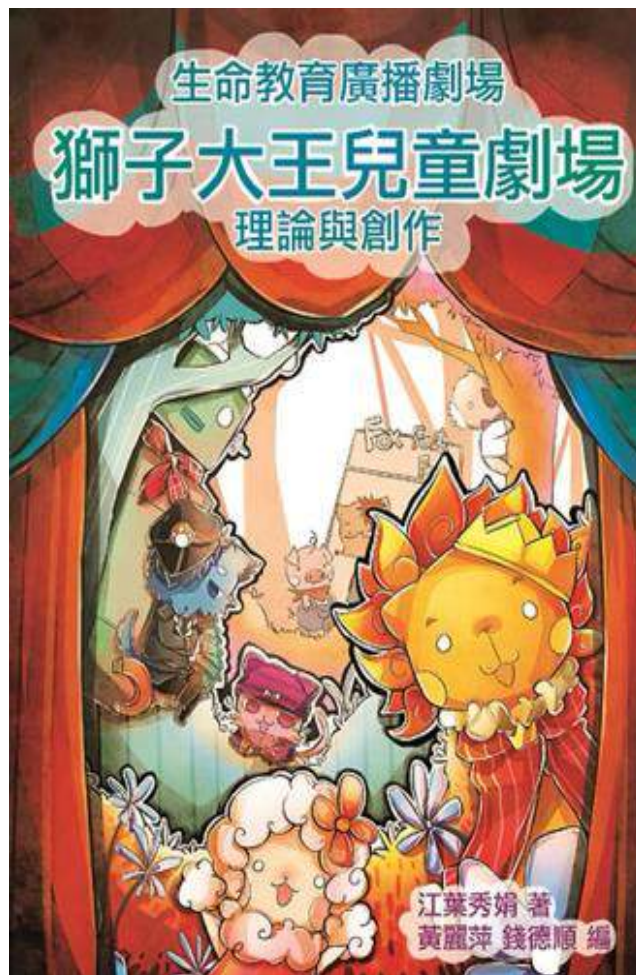
江葉秀娟（2016）。獅子大王兒童劇場：理論與創作。香港教師戲劇會

其後，香港教師戲劇會把我的獅子王廣播劇出版成書 2 ，還有中英對照。我在書的第一部份，講述了如何製作廣播劇的技巧，供讀者參考。