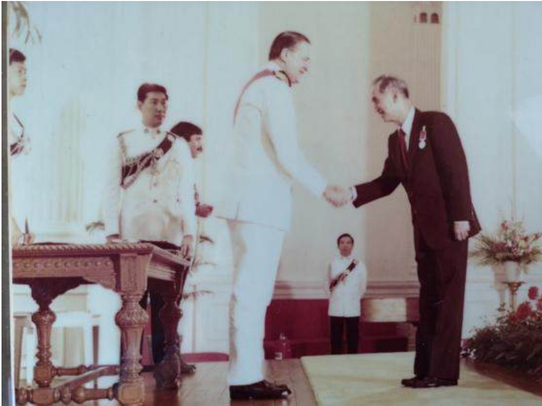
父親葉福於 1978 年由時任港督麥理浩爵士頒授 B.E.M 勳章以示表揚