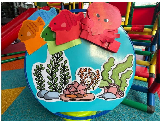
為了配合場景，有時也會 製作一些簡單的帽子或小道具