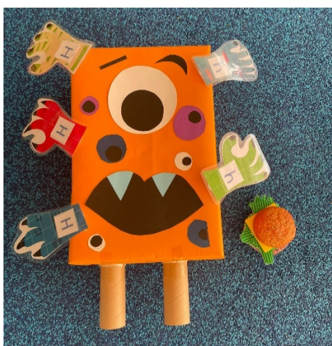
有時會使用廢紙箱或廢紙皮製作教具 廢物常是製作教具很好的材料